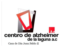
Centro de Alzheimer de la Laguna A.C.