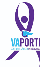
VAPORTI Contra el Cáncer de Páncreas