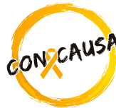
Con Causa por el Cáncer Infantil (Oaxaca)