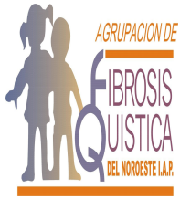
Agrupación de fibrosis quística del noroeste IAP