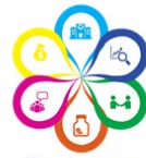
Pacientes en Acción, A.C. Tu voz cuenta