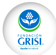
FUNDACIÓN GRISI A.C.