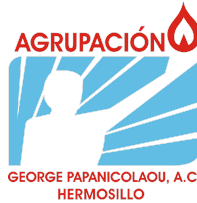
Agrupación George Papanicolaou Hermosillo (Sonora)