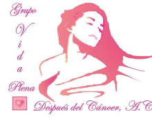
Fundación Vida Plena Después del Cáncer