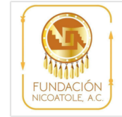
Fundación Nicoatole A.C. (Oaxaca)