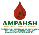
Asociación Mexicana de Pacientes con Anemias Hemolíticas y Sobrecarga de Hierro A.C