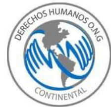
Derechos Humanos ONG Continental A.C.