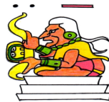
Asociación PALEHUI YOLIA AC (Hidalgo)