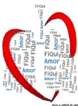
Amor y calidad de vida con Fibrosis Quística