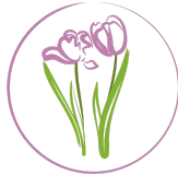
CECPAM CENTRO DE CUIDADOS PALIATIVOS DE MÉXICO