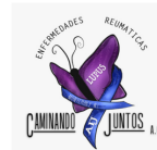
Caminando Juntos A.C