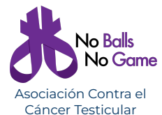
Asociación Contra el Cáncer Testicular