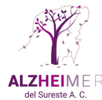
Alzheimer del Sureste A.C.