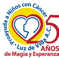
Proayuda a Niños con Cáncer Luz de Vida A. C.