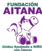
Unidos por Aitana A.C. (Quintana Roo)