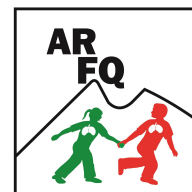
Asociación Regiomontana de Fibrosis Quística, A.C. "Caminando y respirando juntos, desde 1999"